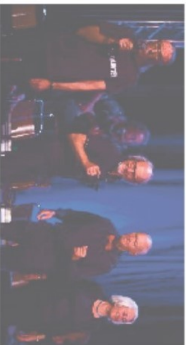
Mit Wort, Lied, Klang und Spiel wurde in Weiz deutlich gemacht, was ältere Menschen der Gesellschaft geben könnten.

Unter dem Namen „Wilde Alte“ hat die Gruppe unter der Äg-